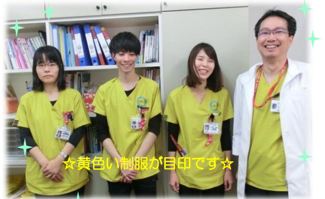
☆黄色い制服が目印です☆